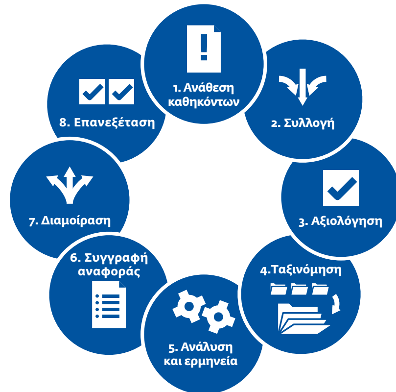
Γράφημα 4: Κύκλος πληροφοριών

Η βασική προϋπόθεση του κύκλου της πληροφορίας είναι ότι η συστηματική αξιοποίηση των πληροφοριών οδηγεί σε αποτελεσματικά προϊόντα που επιτρέπουν στους φορείς λήψης αποφάσεων να αντιμετωπίζουν τους κινδύνους.